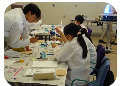
昨年の実験のようす