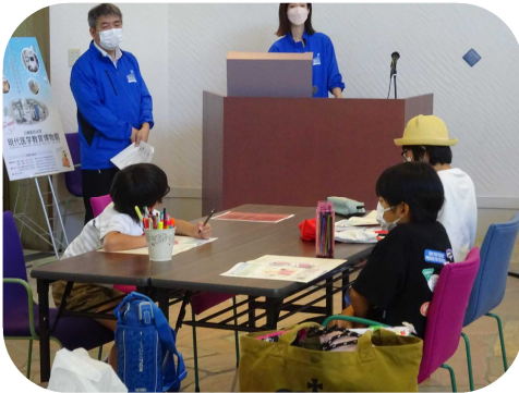
昨年 さくねん のようす

紙エフロンにシールをはって、 体の中の臓器 どうき のぼしょや 大きさを学ぼう!