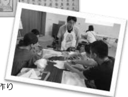
昨年の様子→ 臓器エブロン作り