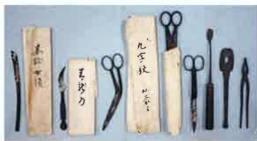
華岡流外科器具 江戸時代後期