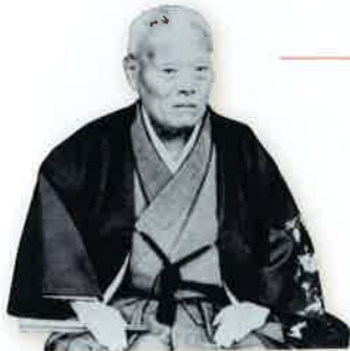
山田純造 (1836~1916)