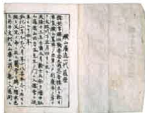
「横山香杏一代記録」 1882(明治15)年 (資料はすべて真庭市所蔵)