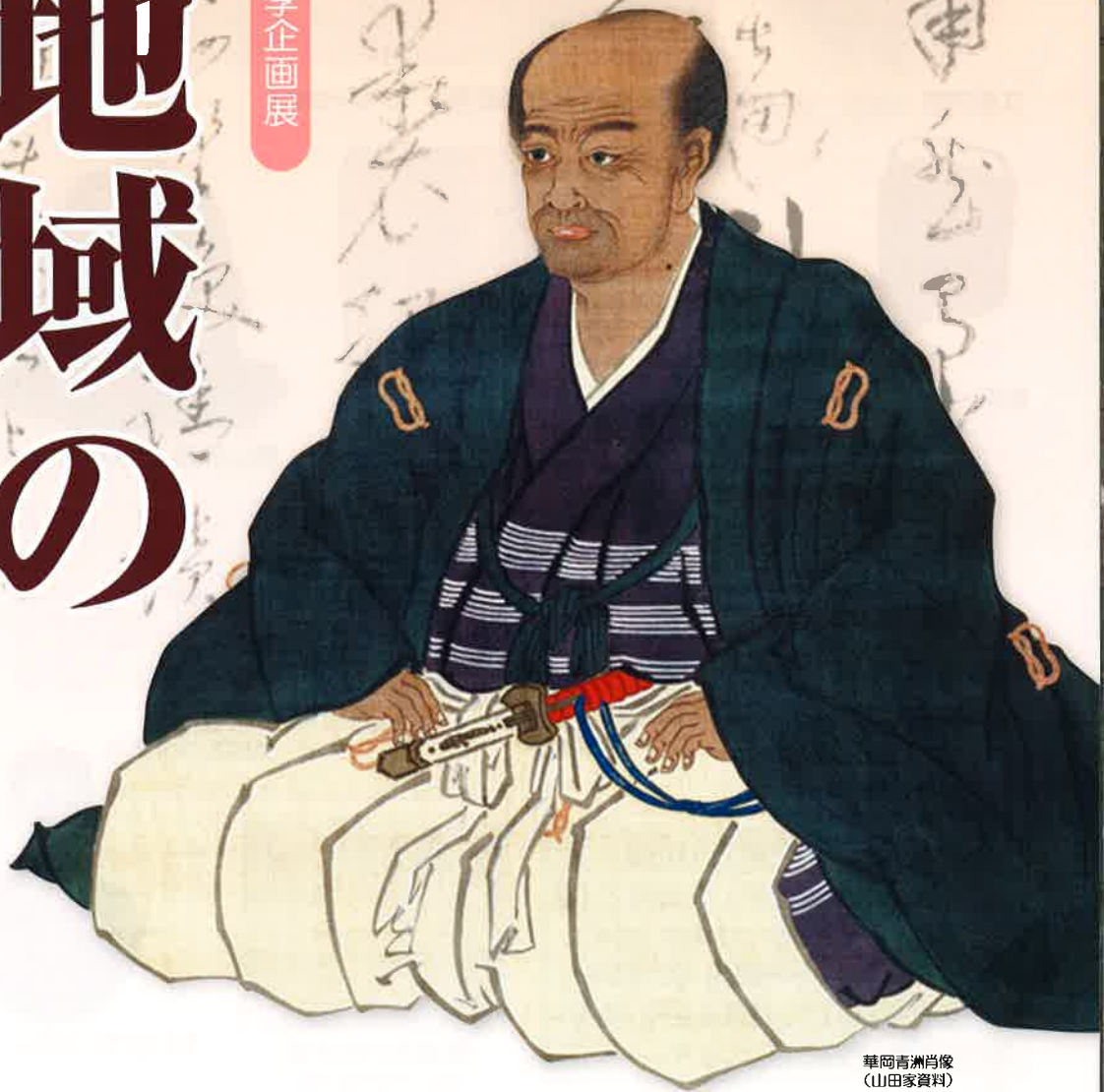
華岡青洲肖像 (山田家資料)