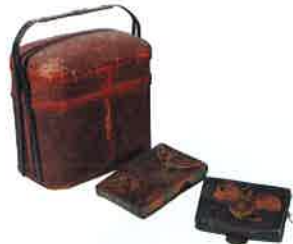
薬箱・薬入 江戸~明治期