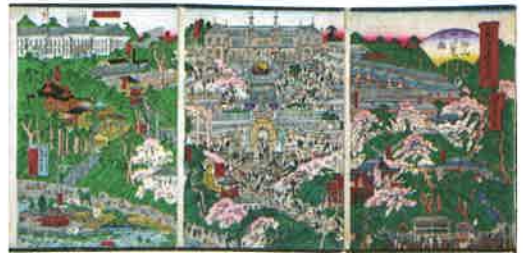
東京名所之内 上野山内一覽之図