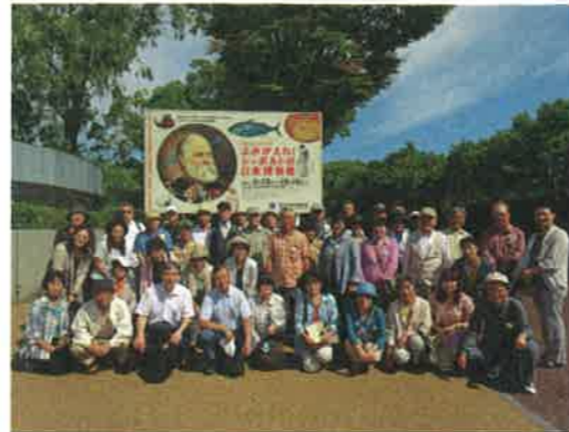
国立民族学博物館で記念撮影

この特別展は、現在ミュンヘン五大陸博物館が所蔵するシーボルトの収集資料から、シーボルトが構想した日本博物館を再現するというものでした。千葉や東京、長崎を巡回し、大阪が最後の会場