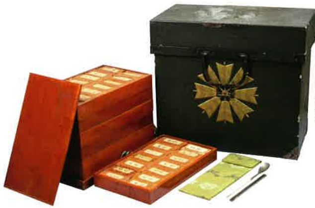
薬箱 江戸時代後期