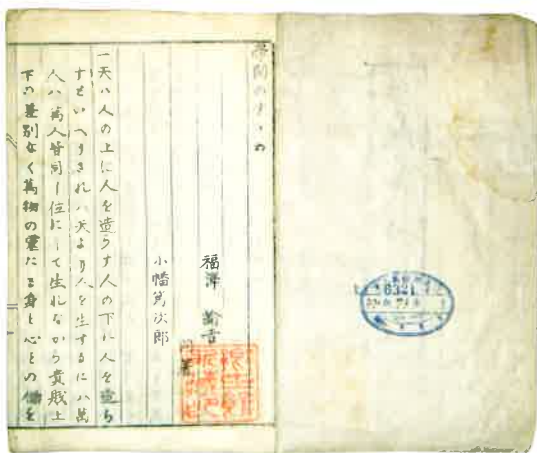
●学問のすすめ 福沢諭吉著 1872 (明治5) 年刊