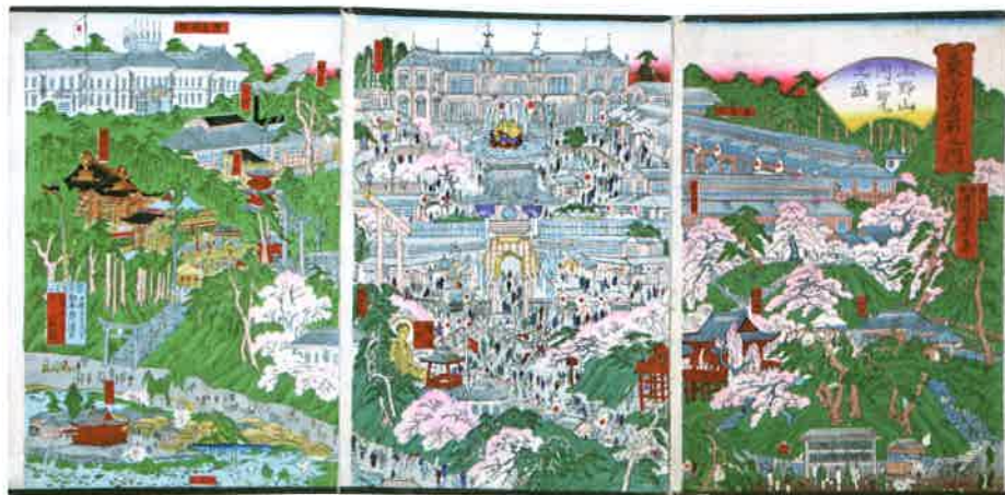
●東京名所之内 上野山内一覽之図 1881 (明治14) 年刊