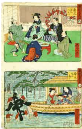
●教訓言黑白 1871 (明治4) 年刊