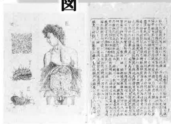
「内象銅版図」扉絵 (初版と重版) 1808(文化5)年