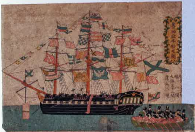
ロシア船を描く 長崎版画 魯西亞本船之図

常設展示には並んでいないけれども、津山の蘭学・洋学を語るうえで貴重な資料のほか、異国文化への関心や明治の文明開化を物語る興味深い資料などを、いくつかの小テーマに沿ってご紹介します。