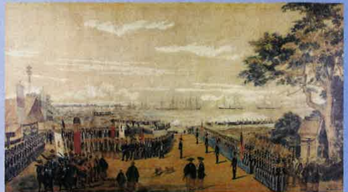
ペリー提督の横浜上陸を描く ウィルヘルム・ハイネ画(複製)