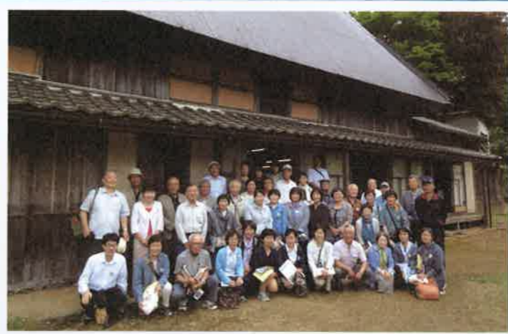
青谿書院の前で記念撮影（養父市）