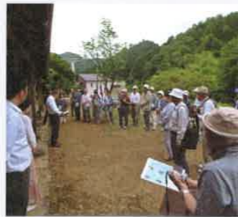
青谿書院で説明を聞きました