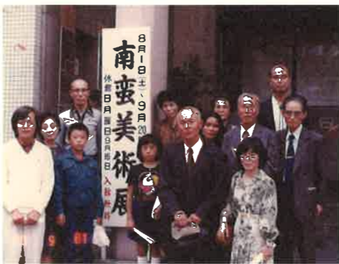
第1回研修バス旅行

同年9月には第1回の研修バス旅行が行われ、神戸の南蛮美術館・滴翠美術館を訪問しました。以降、近隣の洋学関係施設や史跡を訪ねる研修バス旅行、美作地域の