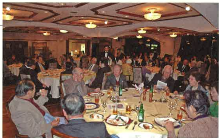
第5回オランダ料理の夕べ（平成18年11月25日）

今年度は創立40周年の記念事業として5月に総会と記念講演会を予定していましたが、岡山県に緊急事態宣言が発令されたことを受けて延期となりました。記念研修旅行や祝賀会（オランダ料理の夕