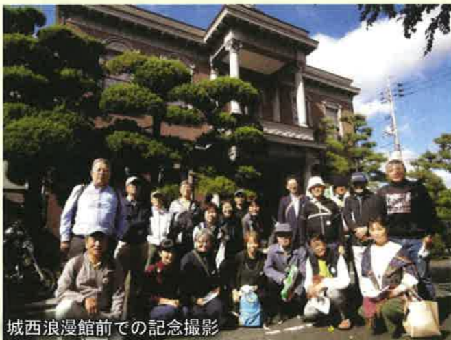
城西浪漫館前での記念撮影

そして、南新座へ移動し、知新館(平沼家旧宅)を外から見学して、全ての行程を無事に歩き終えることができました。参加者の皆さん、どうもありがとうございました。